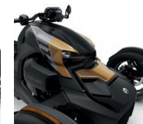
Fiebre del oro