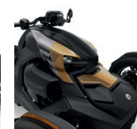
Fiebre del oro